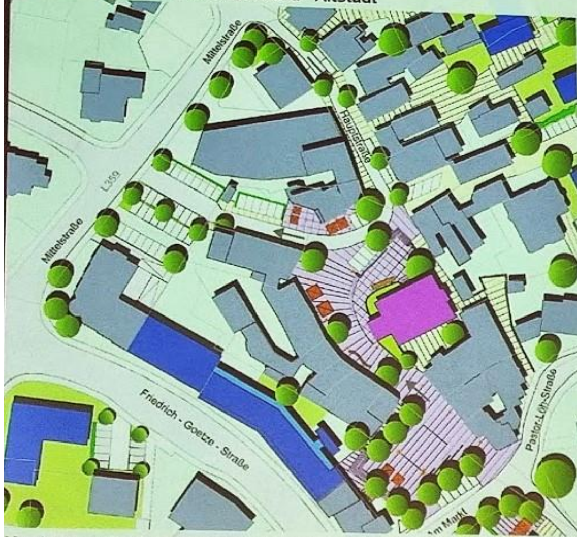
Masterplan IEHK 2025 mit Veränderungen im Plangebiet