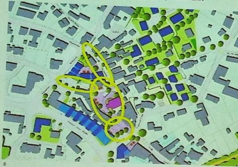
„Burscheid 2030 – Innenstadt Nord - Altstadt“ Maßnahmenübersicht